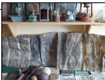
Fragment Tory ocalonej z pożaru Stoczka w 1939 r.