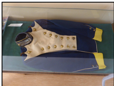
Oryginalny mundur z powstania listopadowego

W Szkolnej Izbie Pamięci Narodowej od ponad 25 lat gromadzone są lokalne źródła historyczne. Ekspонатów przekazanych przez mieszkańców Stoczka, a szczególnie uczniów naszej szkoły, jest tak dużo, że niezbędne jest utworzenie z pracowni historycznej oraz Szkolnej Izby Pamięci Narodowej jednej dużej pracowni regionalnej, pozwalającej na zabezpieczenie i wyeksponowanie zgromadzonych zbiorów oraz pozyskiwanie i gromadzenie nowych.